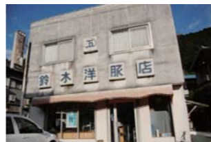
天竜川が形作る景観が美しい場所に店を構える