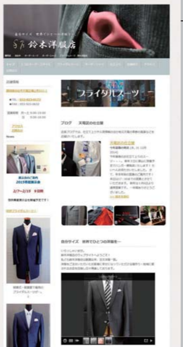
鈴木洋服店のホームページ http://www.tailorsuzuki.jp/ 人気のプライダルスーツへの入口を見やすい位置に配置している

最近力を入れているのはウェディングスーツ。結婚式の後は、上着の丈を詰めるだけでなく、目的に応じてリメイクできるのが強みだ。