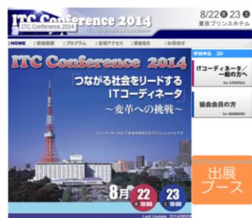
ITCカンファレンス トップページ