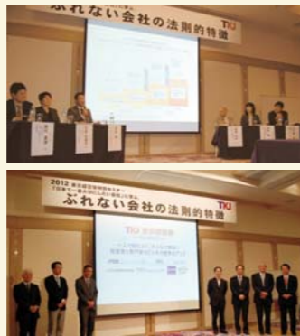
2012年10月5日開催の「ぶれない会社の法則的特長」セミナーの様子