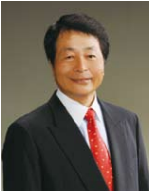
特定非営利活動法人 IT コーディネータ協会