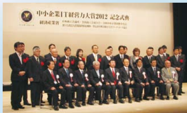
中小企業 IT 経営力大賞 2012 記念式典

IT コーディネータ協会は、大賞事務局として広く全国から優れた IT 経営企業を募集していますが、IT コーディネータの支援した多くのお客様が表彰・認定企業となっています。